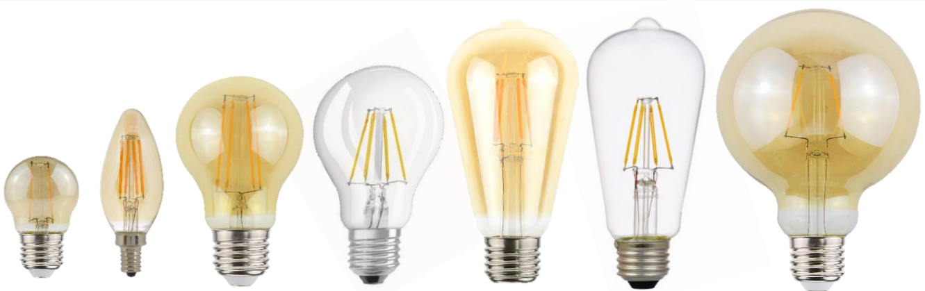
Classic P Classic B